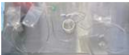
キッティング事例

使用するポンプ、容器、リザーバーの組み合わせによって、最適な配管内容が変化するため、ご要望に応じてご案内いたします。 必要な配管をキッティングし、ガンマ線滅菌済みでのご提供も可能です。詳しくはお問い合わせください。