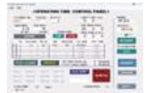
制御ソフトウェア

<セット内容> ポンプ 2台 （※6台まで増設可、接続ケーブル一体 ケーブル長2m） ポンプ取付台座 制御コントローラ 制御ソフト USBメモリ（Windows専用） USB A-MicroBケーブル ACアダプタ（5V 3.0A）