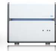
LightCycler® 480 System Roche Diagnostics K.K.