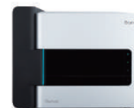
iScan™ System Illumina, Inc.