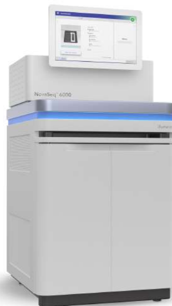
NovaSeq™ 6000 Illumina, Inc.

CAP ACCREDITED COLLEGE of AMERICAN PATHOLOGISTS