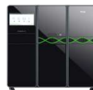
DNBSEQ-T7 MGITech Co., Ltd.